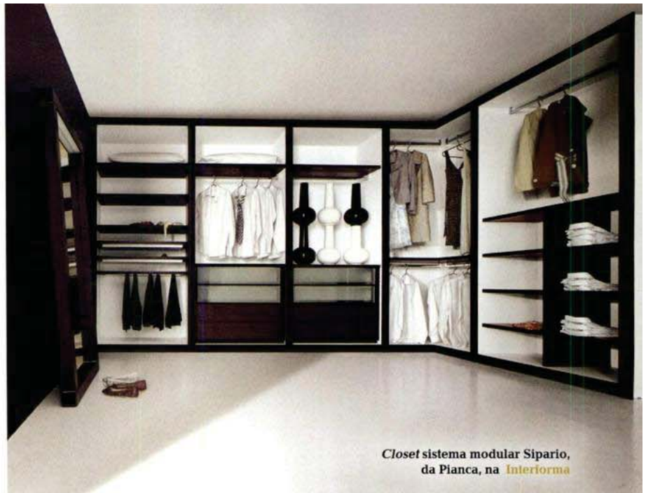
Clôset sistema modular Sipario, da Pianca, na Interforma