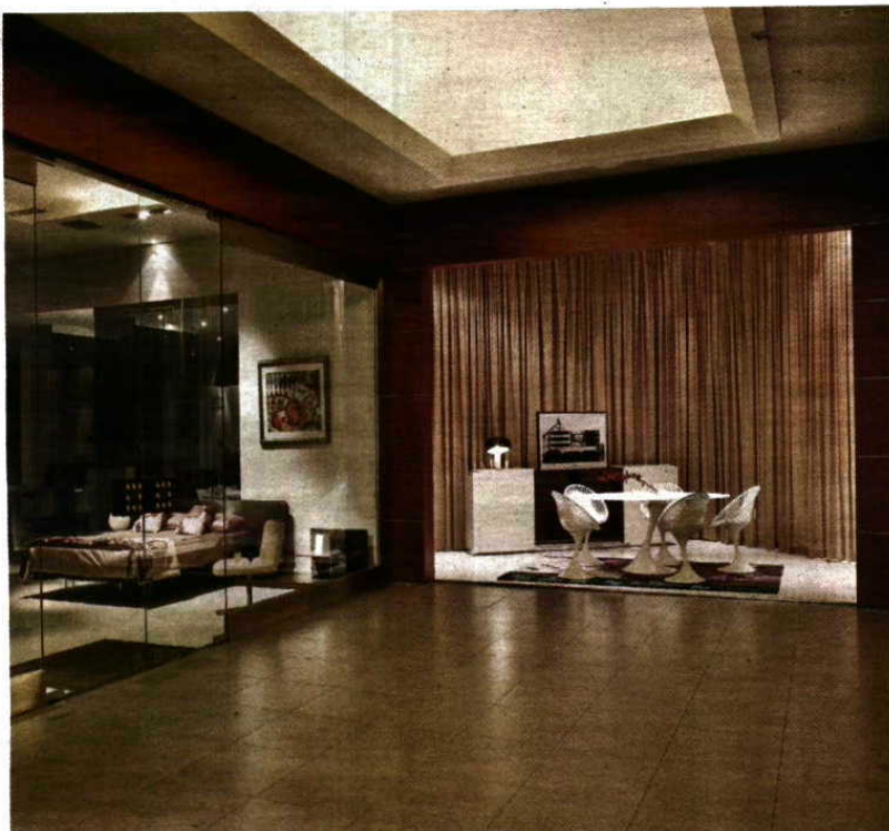
Interior da loja Interforma no edifício do Home Space (Alfragide), concebido de raiz à medida de cada cliente