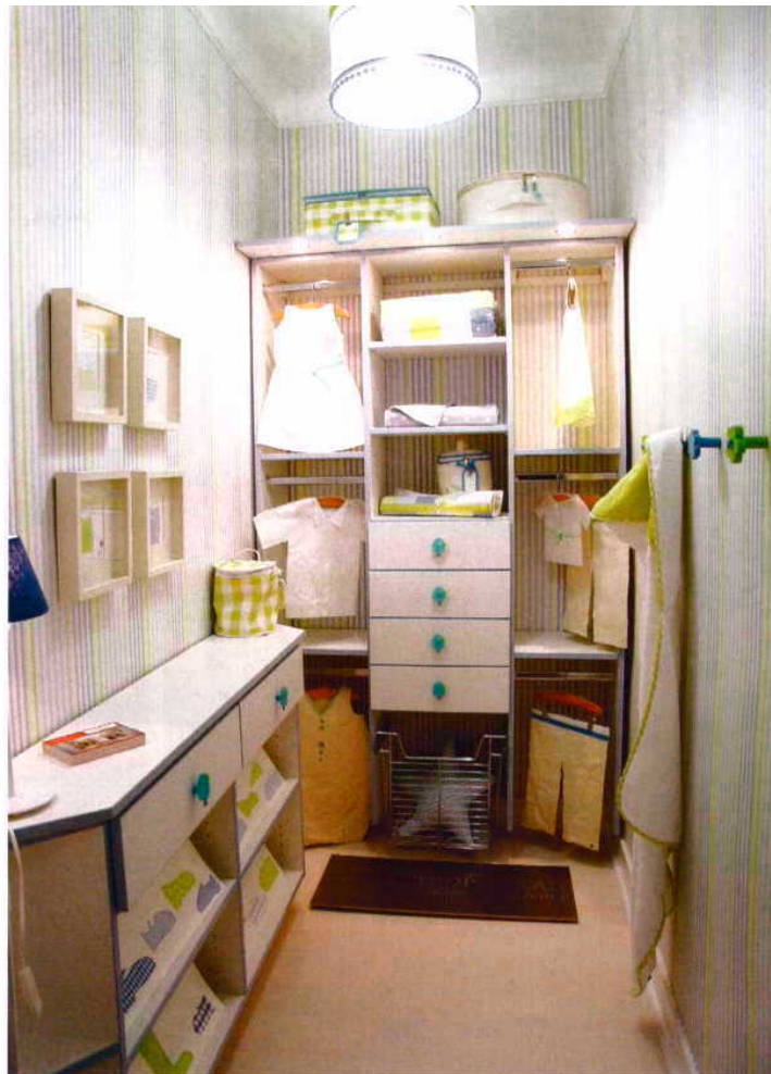
IMAGINÁRIO INFANTIL Aproveitamento de um pequeno recanto transformado em closet para arrumar roupa e brinquedos de criança. Os armários podem dar uma ajuda importante na reorganização da casa quando se anuncia o nascimento de um bebé. Os closets são estudados e feitos à medida, muito práticos, pois podem acompanhar o crescimento das crianças e ser transformados em closets de adulto. Da METROPOLITAN CLOSET COMPANY*