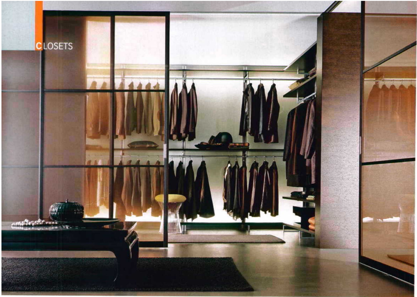
Closet walk in Dress, da Rimadésio, é um sistema para a criação de cabinas de armários com máxima personalização, possibilidades de composições em aplicações lineares, em ângulos e em U, disponível na Paris Sete