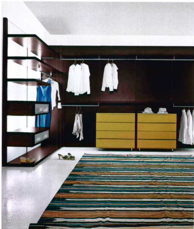
Roupeiro modular Anteprema: preço sob consulta, na Interforma