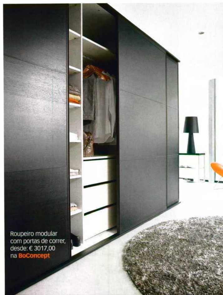
Roupeiro modular com portas de correr, desde: € 3017,00 na BoConcept