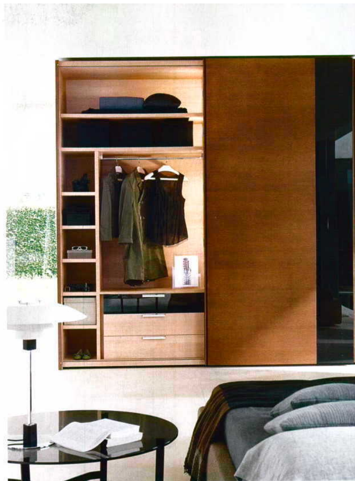
Sistema de closet Gliss, da Molteni, com vários acabamentos disponíveis: preço sob consulta, n' A Linha da Vizinha